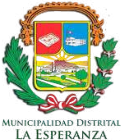
MUNICIPALIDAD DISTRITAL LA ESPERANZA